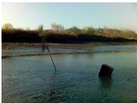
Někdy je potřeba dát si voraz.

Zuřivě jsem popadl podběrák a jal jsem se spravit si chuť tím, že chytanu nějakého kapřička. Výlov byl zatím v plném proudu, na hrázi se tvořila fronta lidí čekajících na toho svého vánočního kapra. Nosili jsme bedýnky ryb sem a tam, jak kdo chtěl a tak na potěšení z lovu