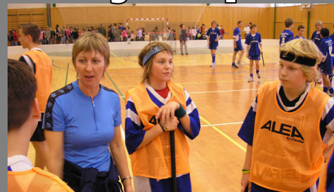
Trenérka udílí poslední rady před utkáním

V posledním utkání celého turnaje jsme narazili na soupeře, který měl v tabulce také dvě výhry. Byl to