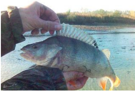
Okoun říční, délku jsme odhadovali na 40 cm, je důkazem, že i neušlechtilé ryby mohou být krásné a dokonale.