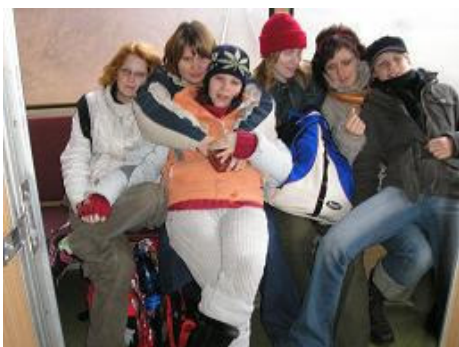
Takhle si užívaly cestu vlakem holky z 9.A

Jako malý vánoční dárek si 7. a 11. prosince I. ZŠ Zruč nad Sázavou pro žáky připravila stejně jako v minulém roce bruslení na zimním stadiónu v Ledči nad Sázavou. Jelikož zájemců bylo mnoho, nemohly jet všechny ročníky současně, nýbrž ve dvou skupinách. 7. prosince bruslili zájemci ze šestých a sedmých ročníků a v pondělí 11. prosince osmáci a devátáci.