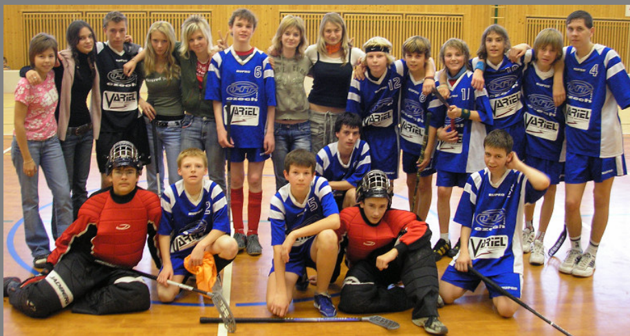
Dole: Naši reprezentanti v objetí fanynek.