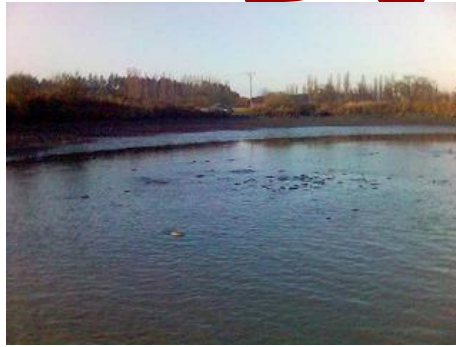
Voda se vaří nekonečnou změť rybích těl